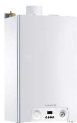
MCX 24 PLUS MCX 24/28 MI PLUS