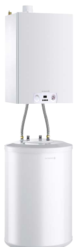
MCX 24 PLUS z podgrzewaczem 120 l lub 150 l